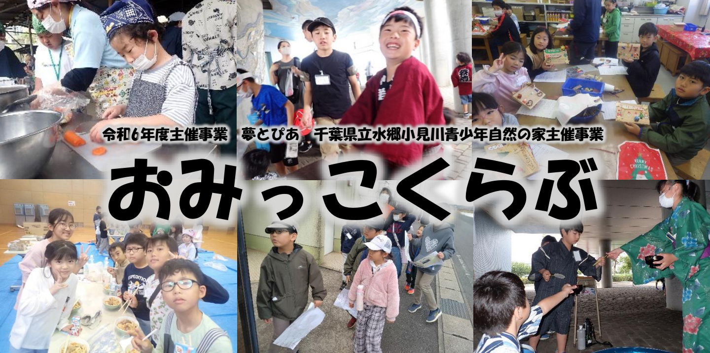
令和6年度主催事業